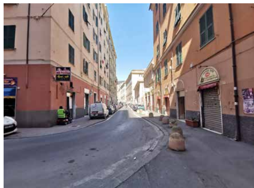
Via Del Lagaccio

Molti tratti di strade, specie tra gli edifici residenziali, si configurano come delle "strade parcheggio" (un esempio è via Ponza) dove la circolazione è assai ridotta e resa difficoltosa dalle auto parcheggiate sovente in modo irregolare. Gli spazi per la sosta, sia pubblici sia privati, sono nel complesso insucienti e tale scarsità si ripercuote con fenomeni di congestione e di degrado degli spazi liberi.