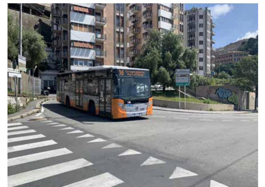
Via G. Avezzana - Salita Della Provvidenza