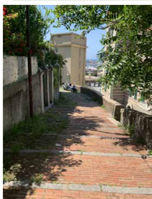
Salita Di Oregina

Il quartiere presenta, disposti da sud a nord, alcuni percorsi di antica origine e prevalentemente pedonali; sono ancora relativamente ben conservati e leggibili quelli costituiti, dove persistono ampi tratti di mattonate che testimoniano la storicità delle percorrenze.