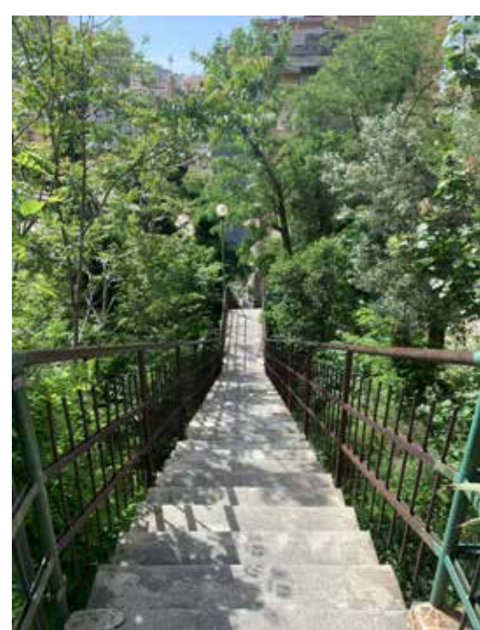
Via Del Lagaccio - Via Bari

Il quartiere presenta, disposti da sud a nord, alcuni percorsi di antica origine e prevalentemente pedonali; sono ancora relativamente ben conservati e leggibili quelli costituiti, dove persistono ampi tratti di mattonate che testimoniano la storicità delle percorrenze.