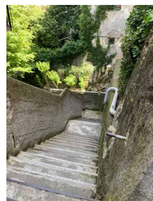
Via Dei Cinque Santi

Scalinate Il quartiere è attraversato da una fitta rete di scale e scalinate, di varie epoche, che risalgono ortogonalmente alle curve di livello le pendici collinari con pendenze spesso assai pronunciate costituendo una alternativa pedonale "di attraversamento" alla mobilità veicolare. Tali scalinate sono in parte pubbliche e in parte private, alcune risultano private di uso pubblico.