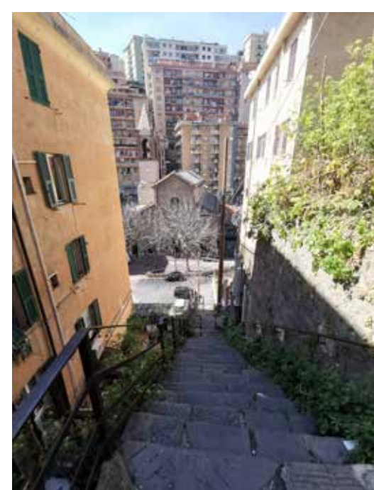
Via Del Lagaccio - Via Ventotene