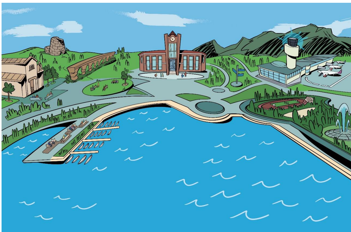
Figura 5. Possibilità educative di ri-territorializzazione 1

La suddetta illustrazione ha lo scopo di raccontare gli elementi emersi lungo il percorso di ricerca in merito alle potenzialità educative del territorio. Per questo motivo si è optato per una rappresentazione approssimativa e non realistica del territorio. La posizione dei luoghi è arbitraria, risponde a specifici intenti comunicativi. Al centro della figura è presente l'edificio scolastico con le porte d'ingresso spalancate, a indicare l'apertura della scuola al territorio. Leggendo l'immagine da sinistra a destra è possibile visualizzare la dimensione temporale emersa dal racconto della comunità, in particolare delle classi. Sono stati inseriti luoghi come la chiesa di San Simplicio, l'acquedotto romano e il nuraghe per indicare la curiosità e l'interesse per la storia e il passato; l'aeroporto rappresenta l'apertura a culture altre per costruire il presente. Le esperienze di dialogo, di scambio e di incontro sono rappresentate nelle piazze, davanti al mare oppure nel parco, luoghi questi ultimi, ritenuti essenziali per fare esperienze piacevoli di apprendimento in mezzo alla natura. In questo senso il territorio acquisisce un valore educante, in quanto i luoghi divengono mezzi educativi e non mero sfondo delle attività umane. Proseguendo la lettura in direzione verticale è possibile scorgere la dimensione comunicante del territorio: da una parte il golfo indica lo scambio e l'incontro con chi