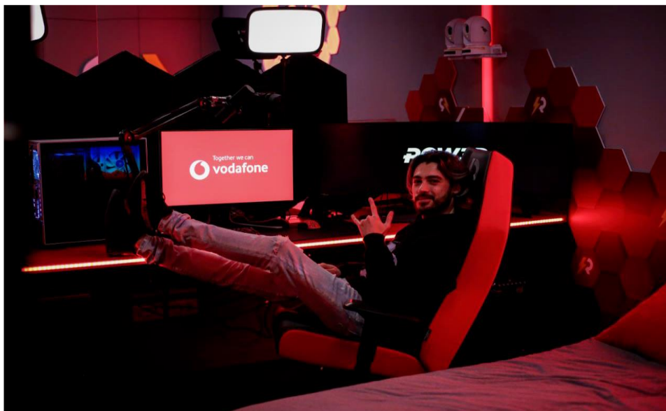
Figura 3.1 Pow3r, ex pro-player attualmente italiano attualmente streamer