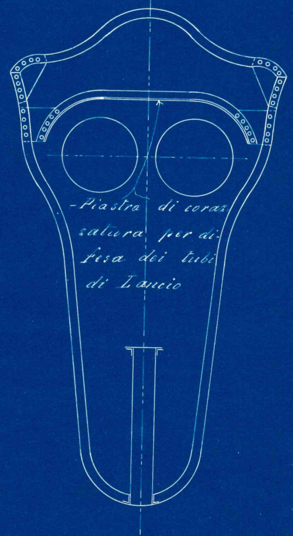
- Piastra di corazatura per difesa dei tubi di Lancio